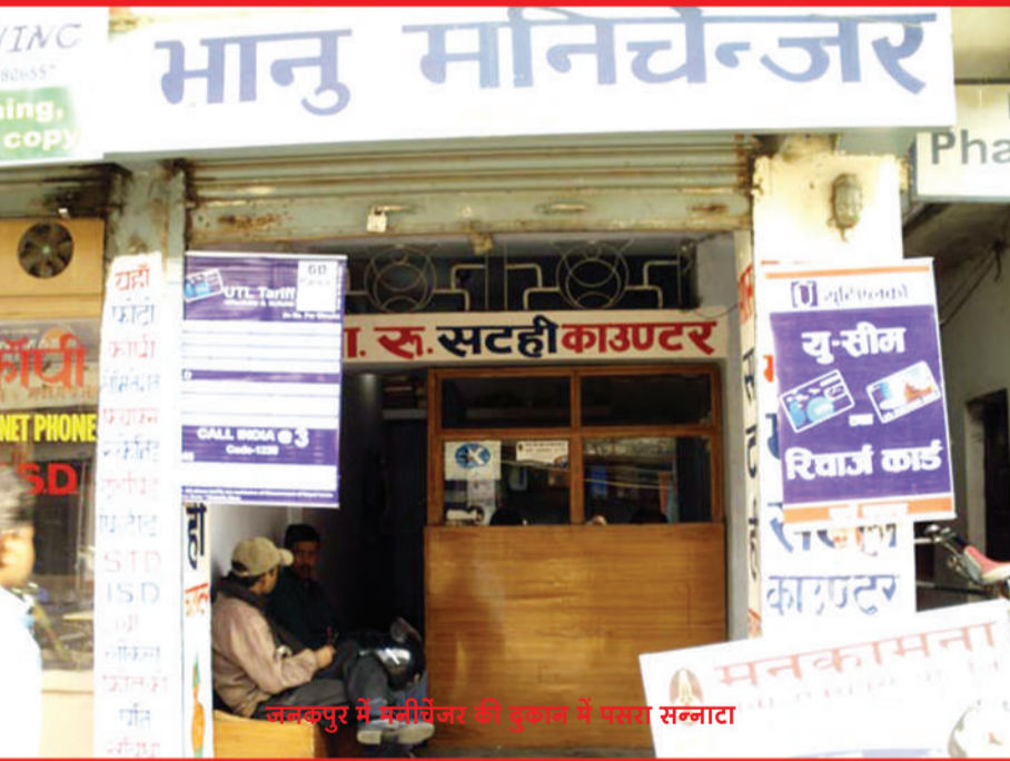
जनकपुर में मनीचेंजर की दुकान में बारा सन्नटा

ने पाल के तराई इलाके में भारतीय मुद्रा के अभाव का अभूत पूर्व संकट छाप रहे से इस इलाके में रहने वाले भारतीय मूल के लाखों नेपाली नागरिकों का जीवन बदतर हो कर रह गया है. भारतीय सीमा से लगा नेपाल का मैदानी भूभाग जिसे स्थानीय स्तर पर मधेश क्षेत्र कहा जाता है, में खाद्यान्न, कपड़ा स्टेशनरी समेत अधिकांश उपभोक्ता वस्तुओं की आपूर्ति भारतीय बाज़ारों से होती है. यह वह विस्तृत भूभाग है जहां भारतीय मूल के नेपाली नागरिकों की संख्या बहुतायत में है. दोनों देशों के नागरिकों के बीच रोटी-बेटी के संबंध एवं भारतीय बाज़ारों पर इनकी निर्भरता के कारण इन्हें हमेशा भारतीय रूपयों की आवश्यकता होती है. जबकि तराई इलाके में भारतीय रूपयों के अभाव की स्थिति यह है कि नेपाल राष्ट्र बैंक के जनकपुर स्थित क्षेत्रीय कार्यालय में भारतीय रूपया लेने के लिए लंबी लाईन लगती है. जहां नेपाली नागरिकों को पहचान पत्र दिखाने के पश्चात अधिकतम 1500 रूपया दिया जाता है. तराई इलाके में भारू के संकट का बेजा फ़ायदा उठा रहे हैं बड़े-बड़े पूंजीपति जो भारू के बदले नेरू आने-पौने कीमत पर खरीद कर मालामाल हो रहे हैं. गौर क़ानूनी तरीके से चलने वाले इन मनी चेंजरों की पौ-बारह का आलम यह है कि अन्तर्राष्ट्रीय मुद्रा विनमय दर (एक भारतीय रूपया बराबर एक रूपया साठ पैसा नेपाली रूपया) की स्थिति एक भारू रूपया बराबर दो नेरू रूपया तक पहुंच गया है.