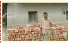
छत्तीसगढ़ में आदिवासी विकास कार्यक्रम (आइफाड) अंतरराष्ट्रीय कृषि विकास कोष और केंद्र सरकार द्वारा 2003 से सरगुजा जशपुर एवं रायगढ़ में संचालित किया जा रहा था.