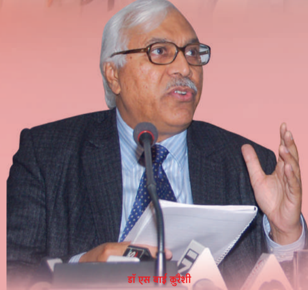
डॉ एस एस कुरेशी

उधर चुनाव आयोग से जुड़े सूत्र बताते हैं कि विशेष परिस्थिति में पुरानी मतदाता सूची पर भी चुनाव कराए जा सकते हैं. समय से पूर्व चुनाव कराने का दूसरा विकल्प जून-जुलाई का महीना है. मतदाता सूची के प्रकाशन के बाद किसी भी दिन चुनाव कराए जा सकते हैं. मौसम के आधार पर भी चुनाव के इस महीने को ख़ारिज़ नहीं किया जा सकता क्योंकि पहले भी इस महीने में राज्य में वोट डाले जा चुके हैं. 1991 के लोकसभा चुनाव में राज्य में जून के आखिरी सप्ताह में वोट डाले गए थे. यही नहीं 1999 के लोकसभा चुनाव में तो राज्य में अगस्त-सितंबर में वोट पड़े थे. नीतीश के रणनीतिकार दोनों विकल्पों को साथ-साथ लेकर चल रहे हैं, क्योंकि सत्ता पक्ष में यह आम राय बनती जा रही है कि समय से पहले चुनाव का फ़ायदा उन्हें ज़रूर मिलेगा. बताया जाता है कि अरुण जेटली जब पटना आए थे तो उस समय नीतीश कुमार से उनकी इस मसले पर बात भी हुई थी. भाजपा के नए अध्यक्ष नितिन गड्करी के लिए बिहार का चुनाव काफ़ी अहम है इसलिए वह